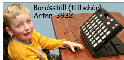
Bordsställ (tillbehör) Artnr: 3932

GoTalk Express 32 är enkel att använda och kan vid behov också användas på ett mer avancerat sätt med länkade meddelanden ( express ). Viktigt för att utveckla brukarens kommunikationsförmåga. Lysdioder markerar varje ruta. Ljudindikering som avlyssnas i hörsnäckan. GoTalk Express 32 ger fler möjligheter än något annat hjälpmedel i den här kategorin!