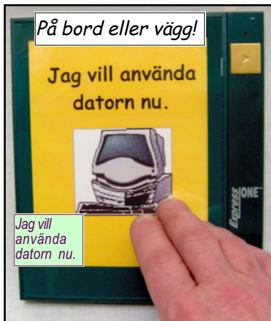
På bord eller vägg!

Bildfickorna (2 st) har formatet 10 x 15 cm. Ett eget meddelande på 10 sek. kan spelas in. Användbar som minnesstöd, meddelanden, booklets med text & tal, mm. Laminerad kartong med begränsad hållbarhet, men billig. Unik och roligt talande hjälpmedel för barn & äldre. Vikt: 48 g. Mått: 127x170 x 5 mm.