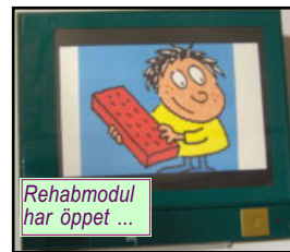
Rehabmodul har öppett ...