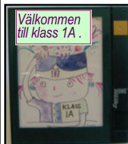
Välkommen till klass 1A.