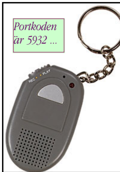
Portkoden är 5932 ...

Minnesstöd för ett meddelande på upp till 10 sek. Den kan bäras i handen, fickan eller fästas på kläderna med ett medföljande bältesclip. Grön plast. Med batterier - typ CR2025.