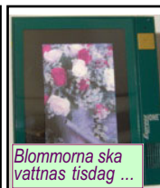
Blommorna ska vattnas tisdag ...