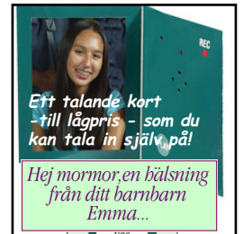
Ett talande kort - till lågpris - som du kan tala in själv på!