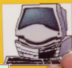
Jag vill använda datorn nu.