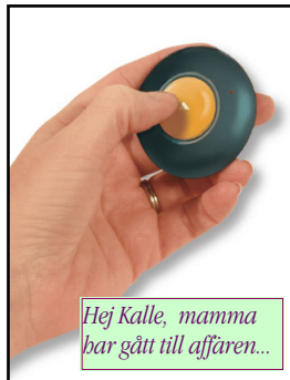
Hej Kalle, mamma har gått till affären...

Minnesstöd för ett meddelande på upp till 10 sek. Får plats i handflatan. Silverfärgad med nyckelring. Med batterier - CR2025.