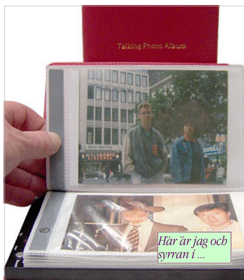
Bilden: 30 bildfickor i A3-format

Total inspelningstid är 4 minuter! 24 bildfickor i formatet 10 x 15 cm. Vikt: C:a 400 g. Mått: 140 x 200 x 33 mm. 2 batterier typ LR03 ingår.